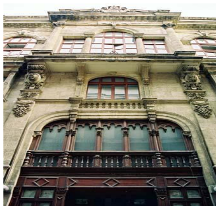
Immeuble de l'ancienne Union Française. Tepebasi, Beyoglu (Péra), Istanbul. https://www.istanbulguide.net/istguide/quartiers/tepebasi.htm

Le soir, première sortie dans Constantinople pour aller dîner à l'Union Française car nous mangions avec les hommes.