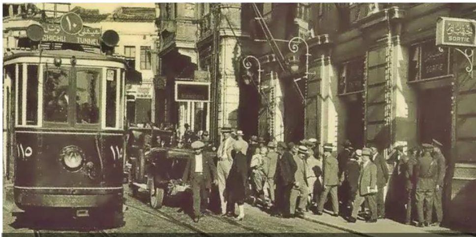
Entrée de la gare de Beyoğlu-Péra

[Le funiculaire souterrain (appelé métro) long de 560 m construit en 1874. Il permet de monter au sommet de la presqu'île de Galata. Il prend son départ au rez-de-chaussée d'un immeuble du bord de la Corne d'or. Au sommet de cette ascension, on trouve l'ancienne Grand Rue Pera (Istikal Caddesi) longue de 2,2 km et parcourue par un tramway pittoresque en zone piétonne. Les motrices sont à truck et captage de courant par archet.]