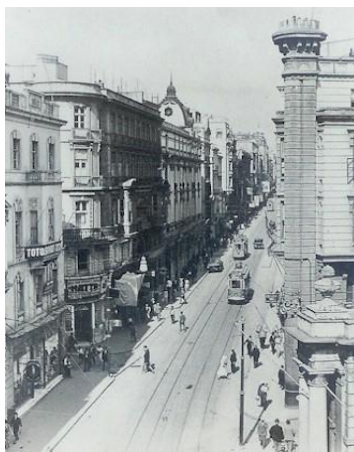
Grand'Rue de Péra

https://www.levantineheritage.com/beyoglu.htm