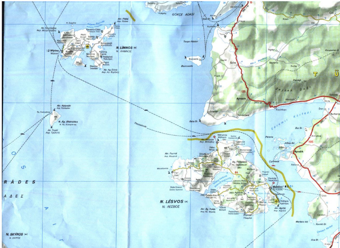
Extrait de carte routière Michelin n° 737

Le 27, à quatre heures, accostons à Sirkeci 39 . Vers trois heures du matin, nous avons failli sombrer par un coup de temps, l'aussière étant trop courte. Heureusement, un officier de marine força le Capitaine du Lorelei à filer de l'aussière et nous nous en sommes tirés mais il était moins cinq.