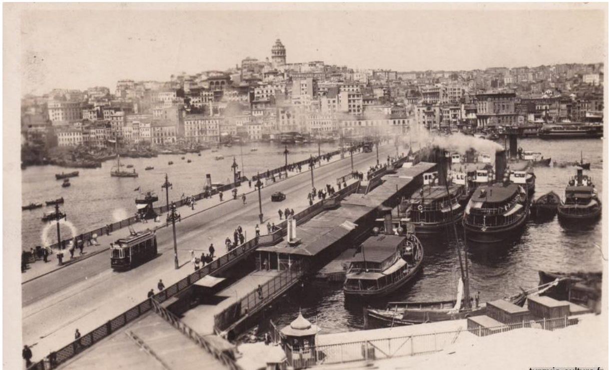
Pont de Galata

Nous n'avons débarqué que vers deux heures de l'après-midi et nous avons pris la direction du gîte d'étape. Nous étions sur la côte gauche de la Corne d'Or et il a fallu traverser le pont de Galata dont le milieu s'ouvre pour laisser passer les navires.